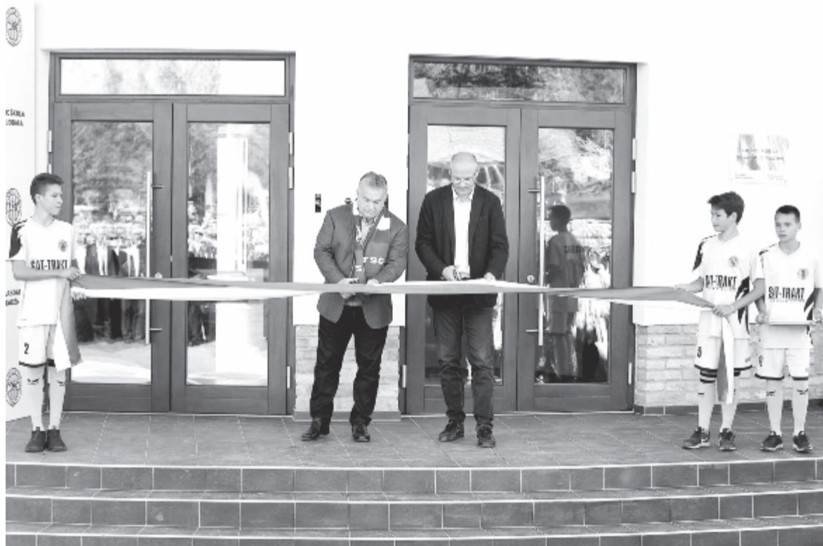
Orbán Viktor magyar miniszterelnök (b) és Zsemberi János, a topolyai TSC labdarúgóklub elnöke átvágja az avatószalagot a TSC Labdarúgó Akadémia megnyitónaplóján a vajdasági Topolyán 2018. szeptember 27-én. A TSC Labdarúgó Akadémia, a hozzá tartozó épületkomplexum a kollégiumi résszel, segédpályákkal, edzőtermekkel, étkezdével és egyéb kiegészítővel együtt a magyar kormány a Magyar Labdarúgó-szövetségen (MLSZ) keresztül nyújtott támogatásából épült fel. A beruházást az MLSZ 9,5 millió euróval támogatta.

Az akadémia jövőképét pénzből nemcsak a topolyai klub részesült, hanem a többségében magyarok lakta településeken működő labdarúgóklubok is.