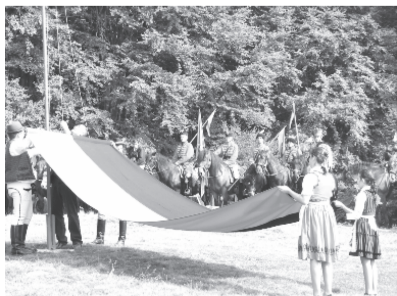
Felhúzták a fekete-piros lobogót, lármafát gyújtottak a hegytetőn

A Falu erdejénél álló sírkertben kezdődött az emlékezés