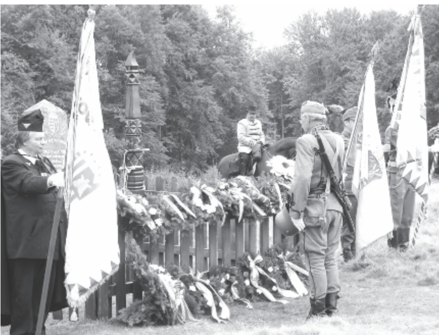
A Körtövés mezején is emlékeztek, koszorúztak

Ezután sor került a lárma meggyújtására. Minden évben egy-egy